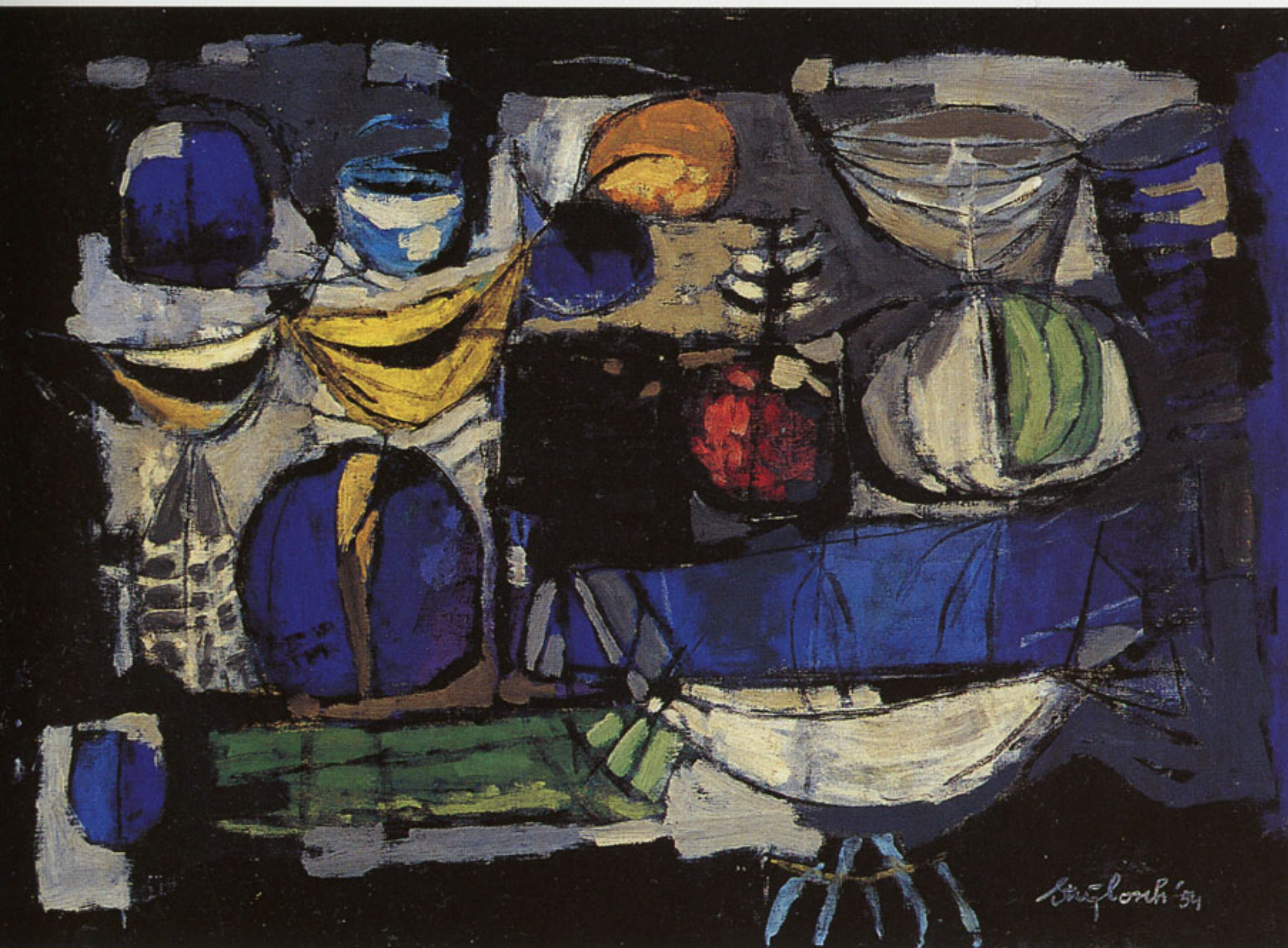
Wim Strijbosch Oiseaux des enfants amoureux , 1954, olieverf op doek, 51 x 72 cm.